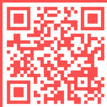
Laman Bersama Hadapi Korona Kemendikbudristek