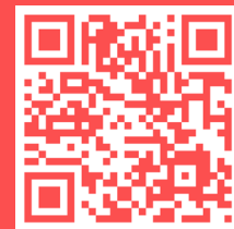
Laman Guru Belajar dan Berbagi Kemendikbudristek